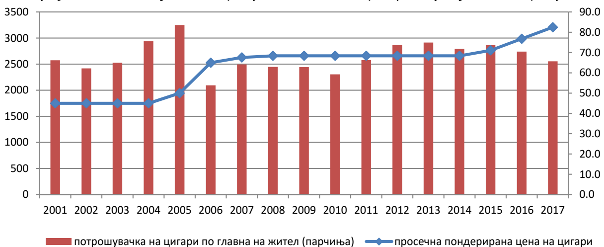
Графикон 2: Оданочување на цигари и движење на цена / потрошувачка на цигари