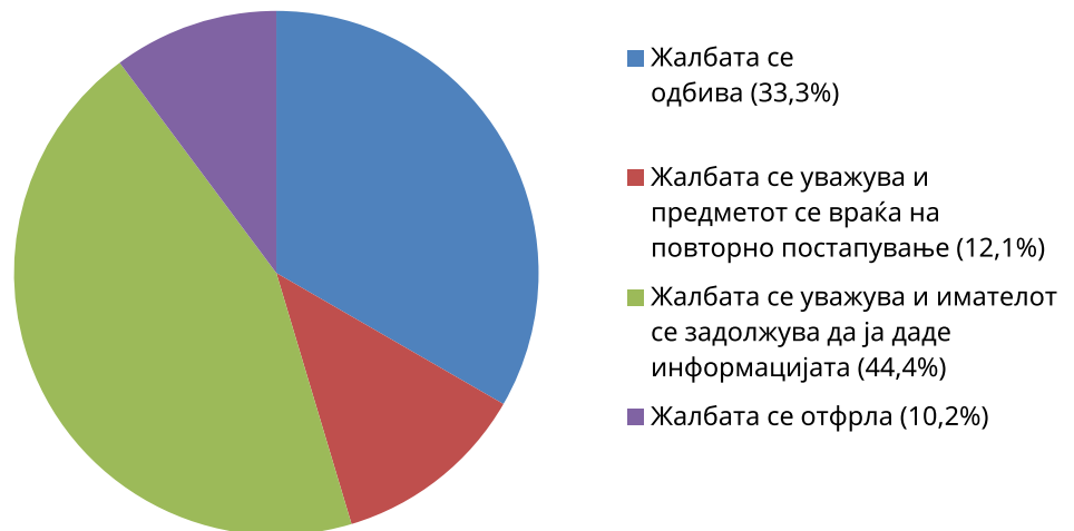
Графикон 2. Донесени решенија од страна на Комисијата

Во сите овие случаи, Комисијата донесла решение со кое се уважува жалбата на барателот на информацијата и се задолжува имателот да обезбеди пристап до информацијата. Сепак, Комисијата нема на располагање механизам кој ќе ги натера имателите да постапат по решението и не постои никаква гаранција дека ќе го сторат тоа, особено ако се има предвид дека истите првично не и ни одговориле на Комисијата за околностите околу случајот.